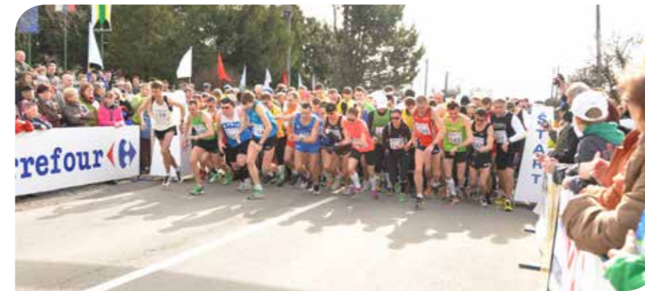
Štart 39. ročníka Behu Olšavskou dolinou