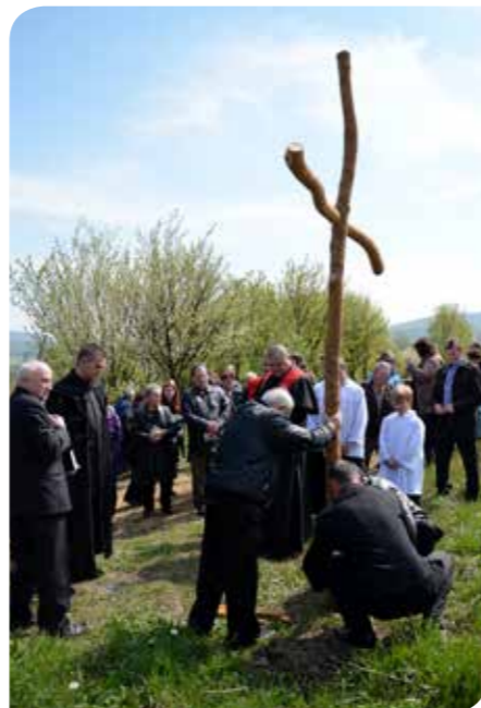
Vztyčovanie dreveného kríža na cintoríne vo Vyšnom Čaji.

Ekumenické podujatie sa vo Vyšnom Čaji koná tradične aj na Silvestra, keď odchádzajúci rok spoločne bilancujú miestni katolíci i reformovaní.