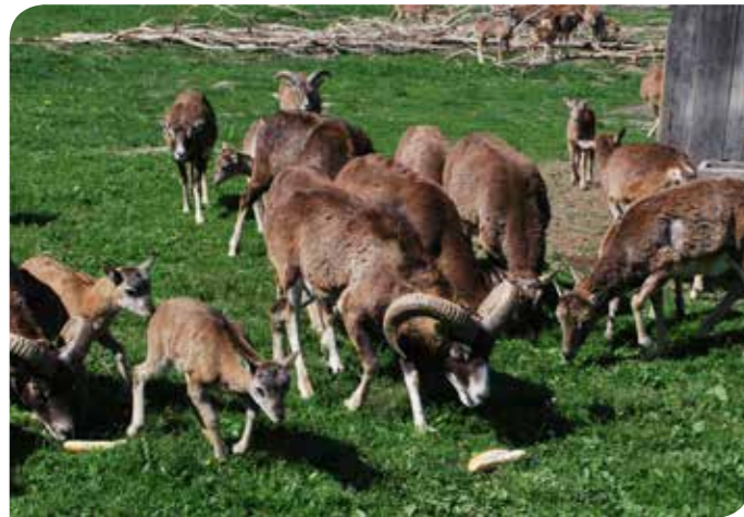
Barany sú pri potrave väčšinou ako prví.