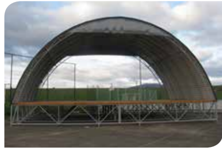
Amfiteáter v Kalši znesie aj prísne kritériá.