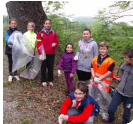
Šikovné deti z Nového Salaša zbierali odpadky.