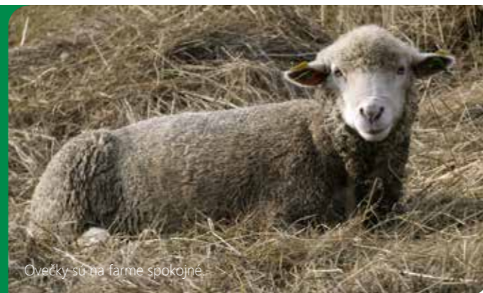
Ovečky sú na farme spokojné.