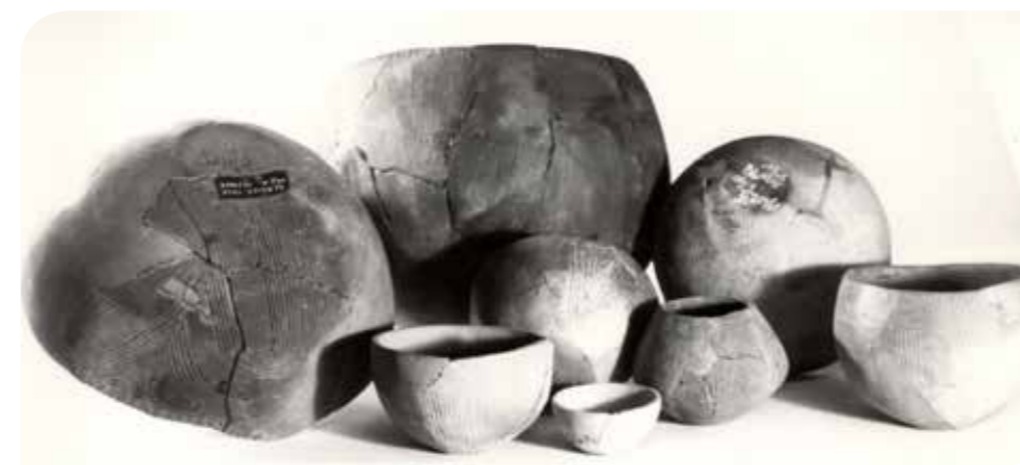
Keramika bukovohorskej kultúry