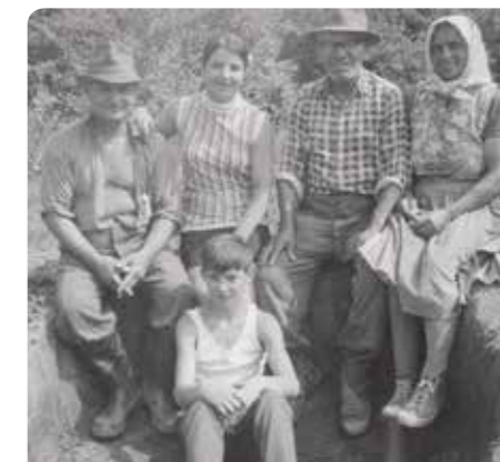
Pomocníci na archeologickom výskume v roku 1970.

Všetky nájdené predmety sú teraz v depozite VSM. Pracovníci múzea však už pripravujú novú archeologickú expozíciu, aby sme ich mohli obdivovať aj my. Sta-