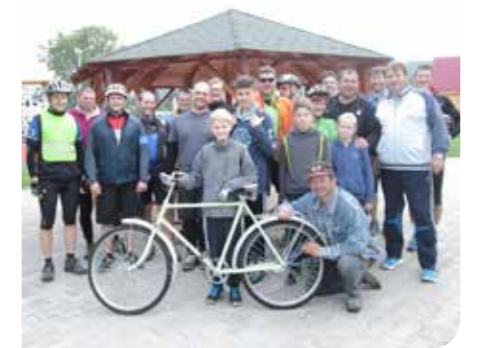
Blažičkí turisti pri novej cyklozastávke v obci.