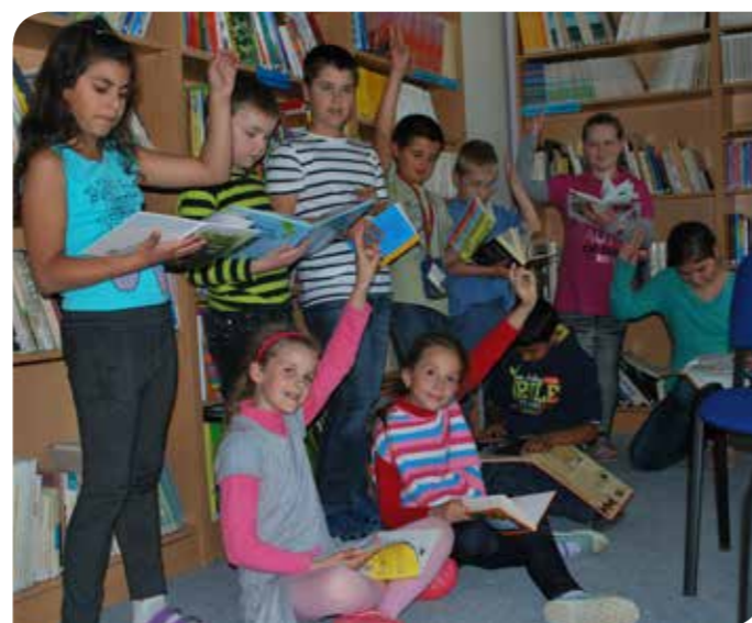
Deti z Bohdanoviec získavajú vzťah ku knižkám v nedávno zriadenej školskej knižnici.

Monika Florianová