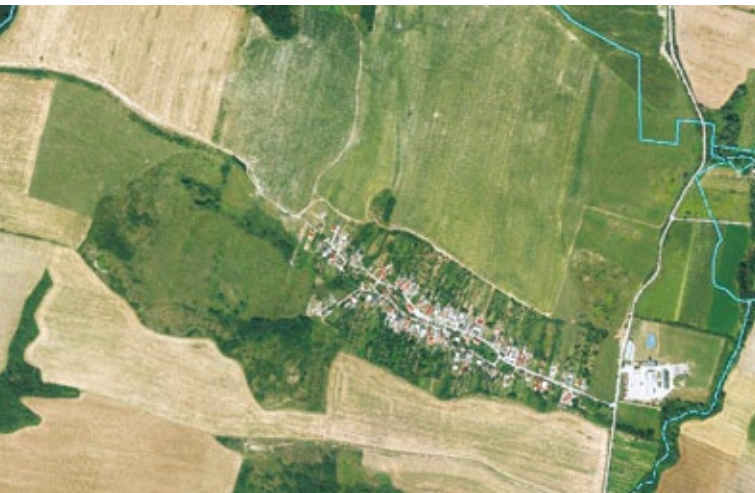
Ortofoto z roku 2012

majú v obci vhodné podmienky pre svoj život a obec sa stáva vyhľadávaným miestom života nových obyvateľov. Záujem o dianie v obci a jej rozvoj neustále stúpa a to hlavne v radoch mladej a strednej generácie, ktorá sa stáva hybnou silou rozvoja obce. Komunikácia s vedením obce prináša svoje ovocie a spoločnými aktivitami prispievajú k neustálemu zvyšovaniu kvality života.