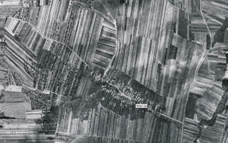
Ortofoto z roku 1950